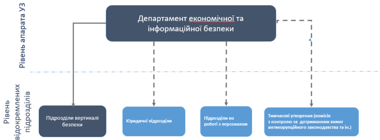
Рис.2. Структура функції з запобігання корупції в 2019 р.